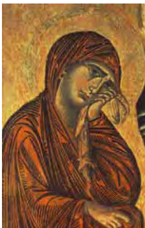
Cimabue, Crocifisso di Santa Croce (particolare)