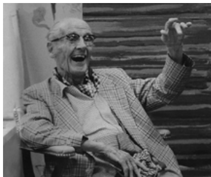
Marcel Moyse, figura fondamentale per la scuola flautista francese e la moderna didattica dello strumento

Il programma prevede l'esecuzione di alcuni tra i più celebri brani del repertorio per flauto e pianoforte appartenenti al filone dei cosiddetti Morceaux de Concours del Conservatorio di Parigi.